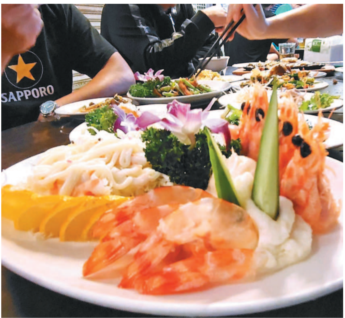
國內最新「台灣食物過敏大調查」顯示，不論哪個年齡層，蝦、蟹等帶殼海鮮均位居過敏原排行之首，約有百分之六成年人食用蝦子後，出現過敏反應。

資料來源／食藥署、林口長庚 製表／元氣中心 聯合報 編輯／葛讓 視覺／劉振華 2024.05.29製表